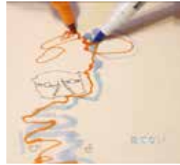
二木詩織 FUTATSUGI SHIORI