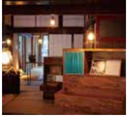
河面理栄 KOUMO RIE