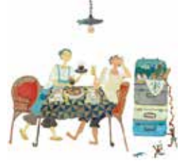
オオサワアリナ OSAWA ARINA