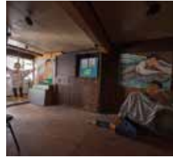
菊地風起人 KIKUCHI FUKITO