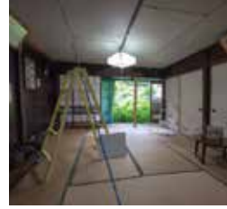
奥谷風香 OKUTANI FUKA