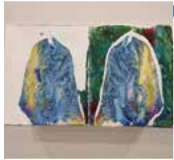
伊藤美緒 ITO MIO