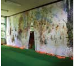
岩熊力也 IWAKUMA RIKIYA