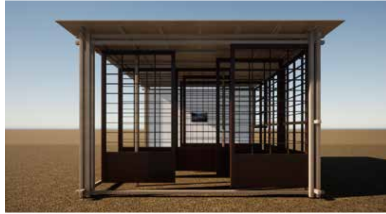
三時の光と場 @向畑(木祖村小木曾)

山々の間に深いV字を刻む木曾谷。その一番奥に位置する木祖村小木曾地区。冬至の近づく秋になると太陽は午後三時に山の向こうへと姿を隠してしまう。環境が人間や文化を作り出すのであれば午後三時に目にする最後の光はここで生活するものに独自の美意識を芽生えさせるのではないかと。私たちは小木曾地区の会場にて午後三時の光で鑑賞する展覧会を開催します。場の環境とともに存在するアート空間をアーティストたちと作り上げていきたい。