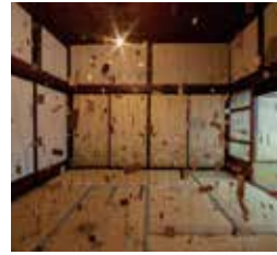
菅野由紀 KANNO YUKI