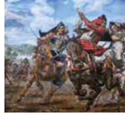
田村佳文 TAMURA YOSHITAKE