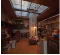
高澤日美子 TAKASAWA HIMIKO