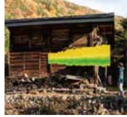
山本晶 YAMAMOTO AKI