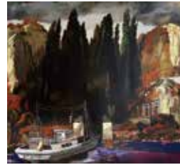
平川恒太 HIRAKAWA KOTA