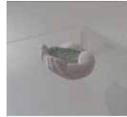
榮水亜樹 EIMIZU AKI