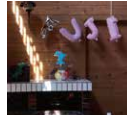
加藤優奈 KATO YUUNA