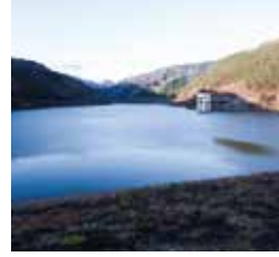
澤頭修自 SAWAGASHIRA SYUJI